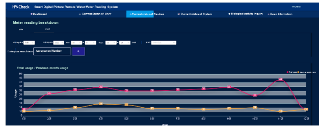
▲ 「HY-CHECK」のモニタリングダッシュボード画面